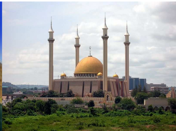
Mosquée Nationale – ABUJA (Nigéria)

Et bien sûr, pour tout don, conseil ou projet contactez-nous aux coordonnées habituelles qui figurent ci-dessous, rahimakoumouLlâh