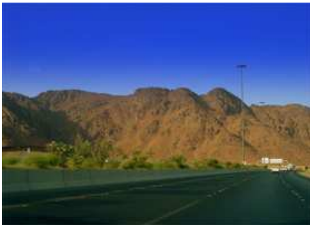
La montagne de Ouhoud – MEDINE (Arabie Saoudite)