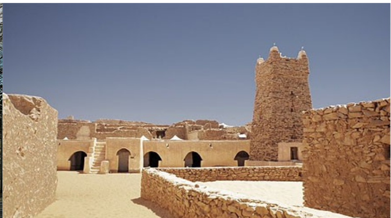
Mosquée – CHINGUETTI (Mauritanie)

Bilâl ibn Sa'd a dit : « Un homme peut être trompé, il est joyeux, mange, bois et rit, alors que dans le Livre d'Allah il est écrit qu'il est un combustible de l'Enfer. » (Sifah As-Safwah, 4/216)