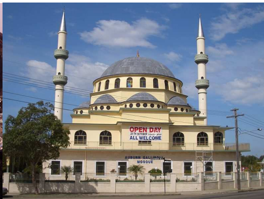
Mosquée Gallipoli – AUBURN (Australie)

Et bien sûr, pour tout don, conseil ou projet contactez-nous aux coordonnées habituelles qui figurent ci-dessous, rahimakoumouLlâh Qu'Allâh vous accorde la réussite dans l'accomplissement de tout bien !