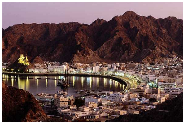
Masqat - OMAN