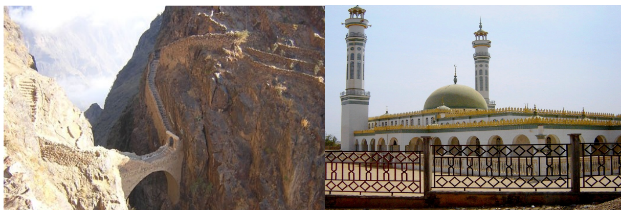
Pont de pierre à 2600 m d'altitude - SHIHARA (Yémen) Grande mosquée – NGAOUNDERE (Cameroun)

Et les gens n'ont jamais rien gagné des rébellions contre les dirigeants!